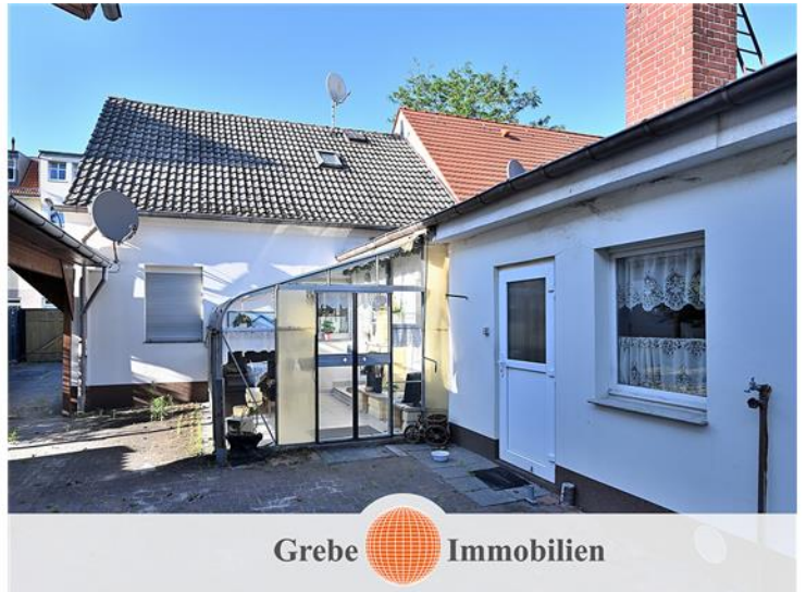
... mit DHH und ...