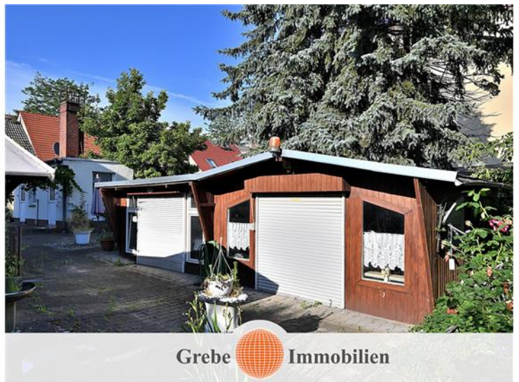
... sowie leichter Bebauung ...