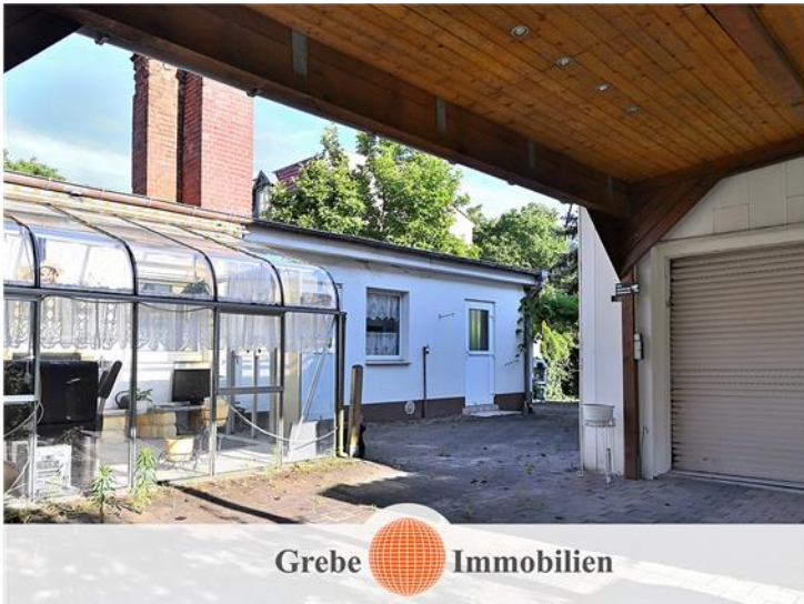
Bebautes Grundstück ...