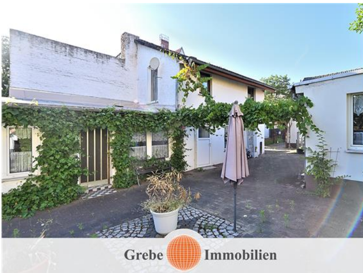
... Nebengelaß ...